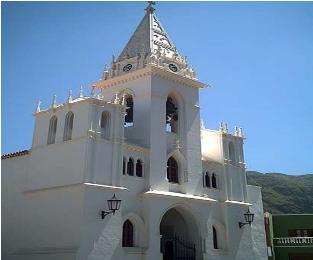
Iglesia Ntra. Sra. de la Luz, Los Silos

las mismas y aquí está esa posibilidad, expresa la consejera.