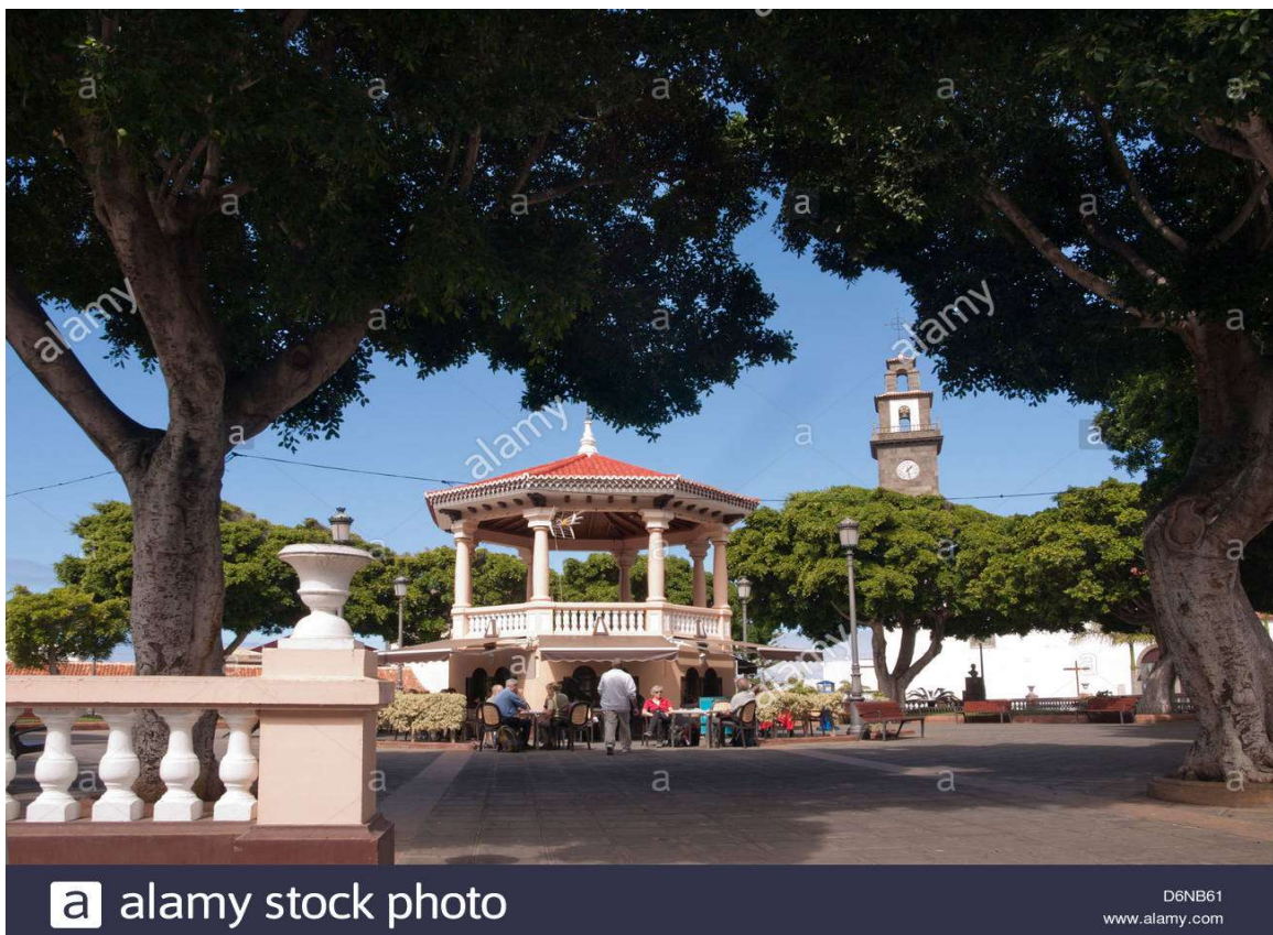
Plaza Ntra. Sra. De Los Remedios, Buenavista del Norte