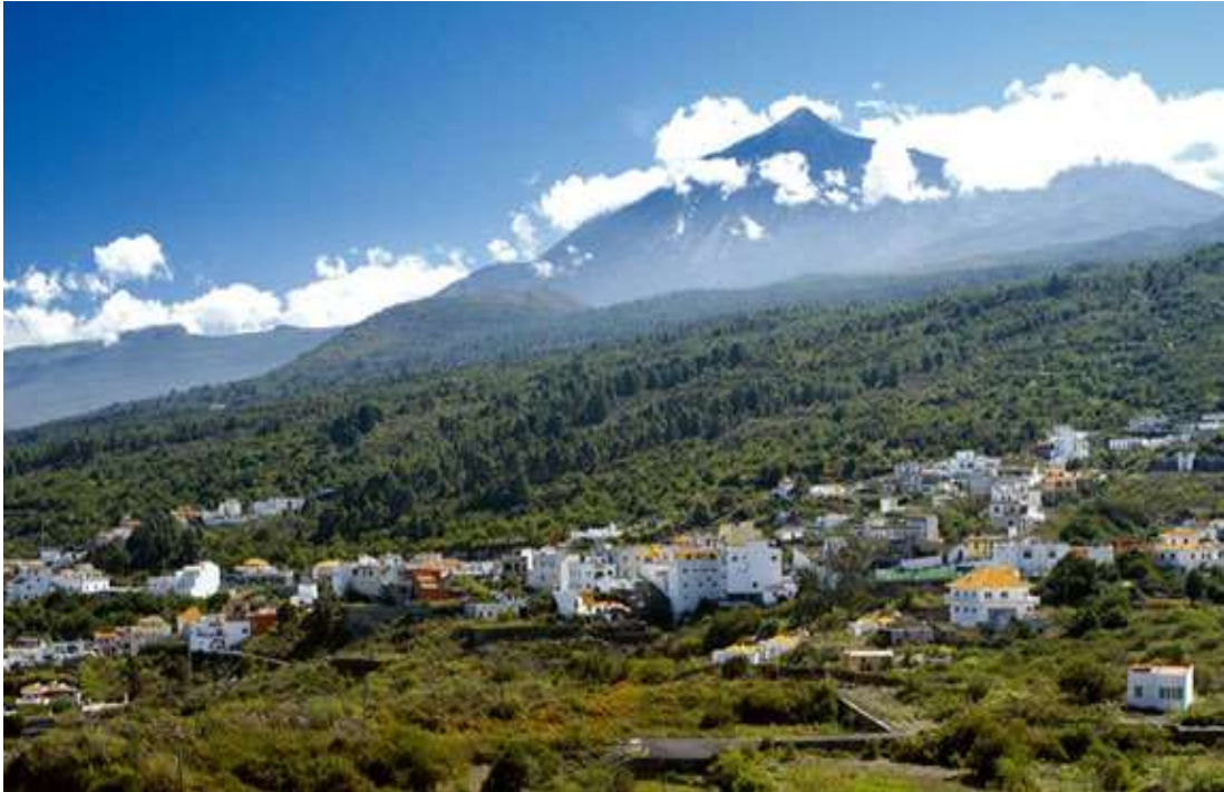
Vista general del municipio de El Tanque