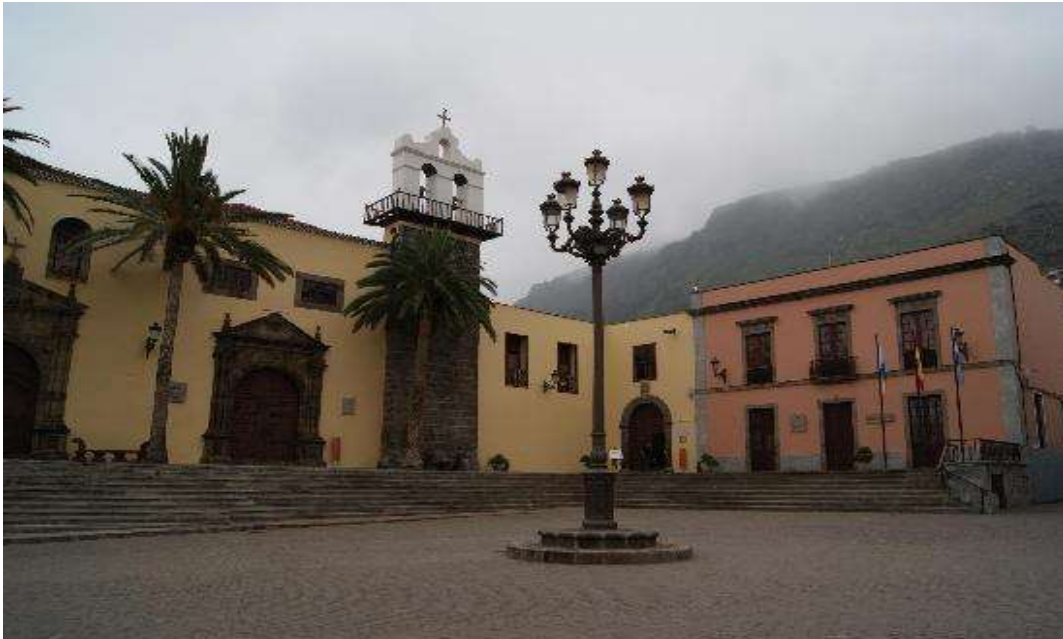
Glorieta de San Francisco, Villa y Puerto de Garachico